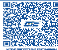
INIZIO E FINE EXTREME TEST BARDHAL