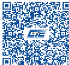
INIZIO ENDURO TEST RED MOTO